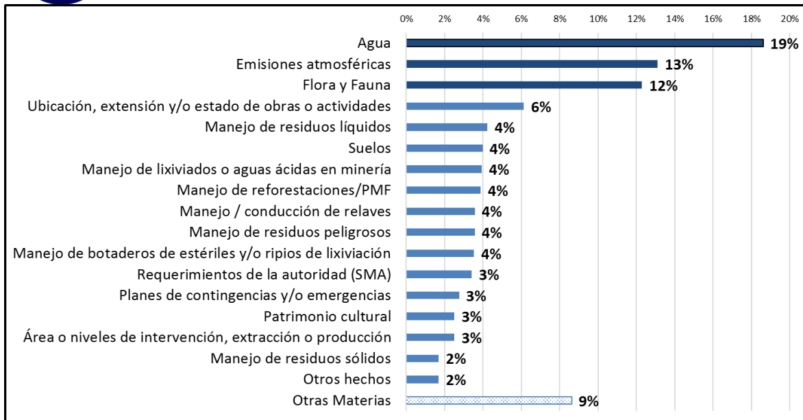
Figura 2: Sistematización de “hallazgos” descritos en una muestra de Informes de Fiscalización Ambiental.